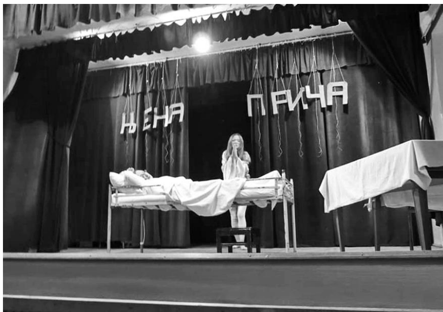
Fotografija 2: Pozorišna predstava “Njena priča”, Kazнено-popravni zavod za žene u Požarevcu, 26. 12. 2018.

I na ostale osuđenice učestvovanje u samom procesu pripremanja i izvođenja predstave, delovalo je oslobađajuće, pomagavši im da prevaziđu inicijalnu tremu i stid zbog pojavljivanja pred zajednicom nakon onoga što su učinile i da se oseće prihvaćeno i osnaženo. U tom smislu, “Njena priča” osobito naglašava princip reintegrativnog postidiivanja, kao jednog od najznačajnijih elemenata restorativnog procesa, ali, svakako i ostale njegove principe, kao što je osnaživanje, praštanje...