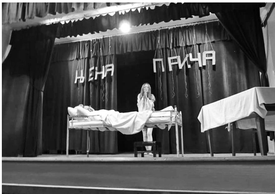
Fotografija 2: Pozorišna predstava “Njena priča”, Kazнено-popravni zavod za žene u Požarevcu, 26. 12. 2018.

I na ostale osuđenice učestvovanje u samom procesu pripremanja i izvođenja predstave, delovalo je oslobađajuće, pomagavši im da prevaziđu inicijalnu tremu i stid zbog pojavljivanja pred zajednicom nakon onoga što su učinile i da se oseće prihvaćeno i osnaženo. U tom smislu, “Njena priča” osobito naglašava princip reintegrativnog postidiivanja, kao jednog od najznačajnijih elemenata restorativnog procesa, ali, svakako i ostale njegove principe, kao što je osnaživanje, praštanje...