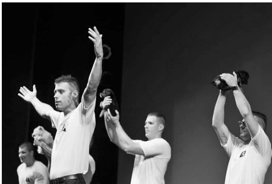
Fotografija 3: Premijera dokumentarnog filma “Komanda ljubav“, Dom omladine Beograda, 14.03.2019.