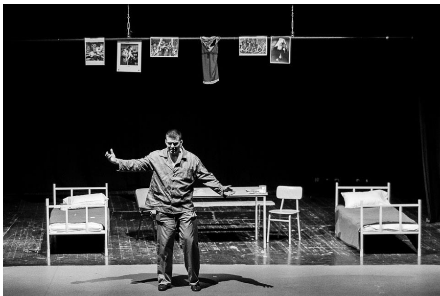
Fotografija 1: Pozorišna predstava “Zapisi iz ćelije broj 12”, Dom omladine Beograda, 07.09.2015.