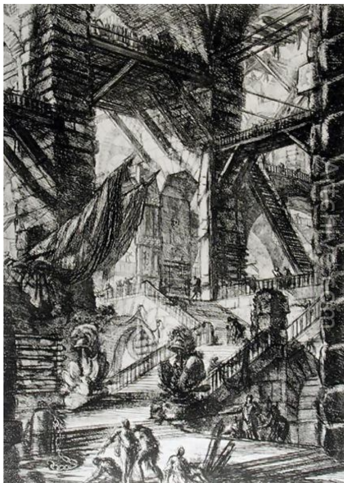
Giovanni Battista Piranesi (1760): Carceri d'Invenzione 2 (Imaginarni zatvor)