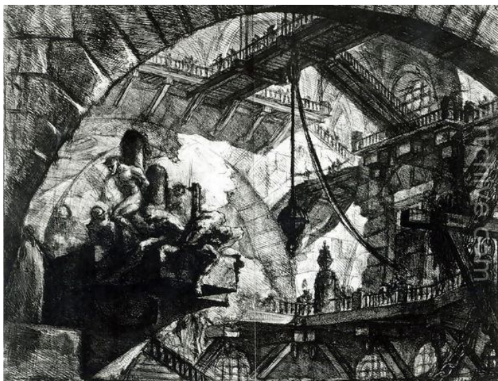
Giovanni Battista Piranesi (1760): Carceri d'Invenzione (Imaginarni zatvor), British Museum, London, England

Giovanni Battista Piranesi (1720 - 1778) je autor serije od 16 gravira "Zatvori" ( Carceri ) koje datiraju iz 1760-ih godina i predstavljaju dramatične i košmarne vizije tamnica kao masivnih arhitektonskih formi sa mračnim senkama i stepenicama koje nikuda ne vode, dok su ljudske figure jedva vidljive, dehumanizovane i sasvim beznačajne. Između uzmemiravajuće psihološke atmosfere ovih arhitektonskih fantazija i Gofmanovih tekstova o totalnim ustanovama iz XX veka postoji istorijsko i metafizičko srodstvo koje još uvek osećaju istraživači koji se bave ovim temama.